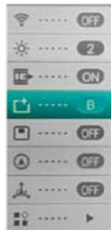
Bild in Bild (PIP): Wenn die Bild-in-Bild-Funktion eingeschaltet ist, erscheint oben in der Mitte ein kleines Fenster mit der 2x Vergrößerung des normales Bildes.

Kalibrierungsmodus: Die Kamera verfügt über einen automatischen internen Shutter. Dieser klickt regelmässig um das Bild neu aufzubauen. Durch diesen erneuert sich das Bild regelmässig und verliert nicht an Qualität. Falls Sie trotzdem vertikale Linien im Bild sehen und Sie diese als störenden empfinden, können Sie das Gerät manual kalibrieren. Drücken Sie dazu die Foto und Zoom Taste gleichzeitig für 2 Sekunden lang. Im Untermenü kann zusätzlich eingestellt werden oben Sie den lautlosen Shutter (B) oder den internen mechanischen Shutter (S) benutzen. Wenn Sie (B) einstellen wird der interne Shutter deaktiviert. Beim Shuttern (Kalibration) müssen Sie entweder die Gummiklappe vorhalten oder zur Not auch die Hand davorhalten um zu kalibrieren. Wenn Sie im B-Modus keine Hand oder den Deckel vorhalten, ergibt sich ein sogenannter Ghost-Effekt und sie sehen die Objekte doppelt, sobald sie die Kamera weiter bewegen. Durch wiederholtes Shuttern mit Deckel verschwindet dieses Ghost-Bild dann aber wieder.