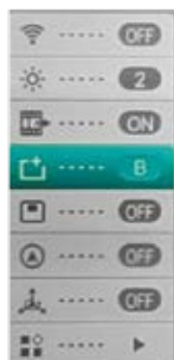
Bild in Bild (PIP): Wenn die Bild-in-Bild-Funktion eingeschaltet ist, erscheint oben in der Mitte ein kleines Fenster mit der 2x Vergrößerung des normales Bildes.

Kalibrierungsmodus: Die Kamera verfügt über einen automatischen internen Shutter. Dieser klickt regelmässig um das Bild neu aufzubauen. Durch diesen erneuert sich das Bild regelmässig und verliert nicht an Qualität. Falls Sie trotzdem vertikale Linien im Bild sehen und Sie diese als störenden empfinden, können Sie das Gerät manual kalibrieren. Drücken Sie dazu die Foto und Zoom Taste gleichzeitig für 2 Sekunden lang. Im Untermenü kann zusätzlich eingestellt werden oben Sie den lautlosen Shutter (B) oder den internen mechanischen Shutter (S) benutzen. Wenn Sie (B) einstellen wird der interne Shutter deaktiviert. Beim Shuttern (Kalibration) müssen Sie entweder die Gummiklappe vorhalten oder zur Not auch die Hand davorhalten um zu kalibrieren. Wenn Sie im B-Modus keine Hand oder den Deckel vorhalten, ergibt sich ein sogenannter Ghost-Effekt und sie sehen die Objekte doppelt, sobald sie die Kamera weiter bewegen. Durch wiederholtes Shuttern mit Deckel verschwindet dieses Ghost-Bild dann aber wieder.