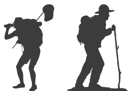
Ornithologen & Wandern